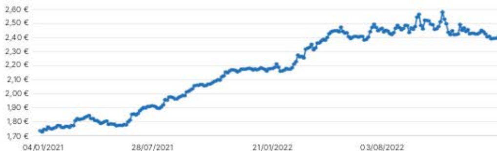
Preisentwicklung in €/g

Der Germanium-Preis ist seit 01.01.2021 bis zum 31.01.2023 um 34,3 Prozent gestiegen.